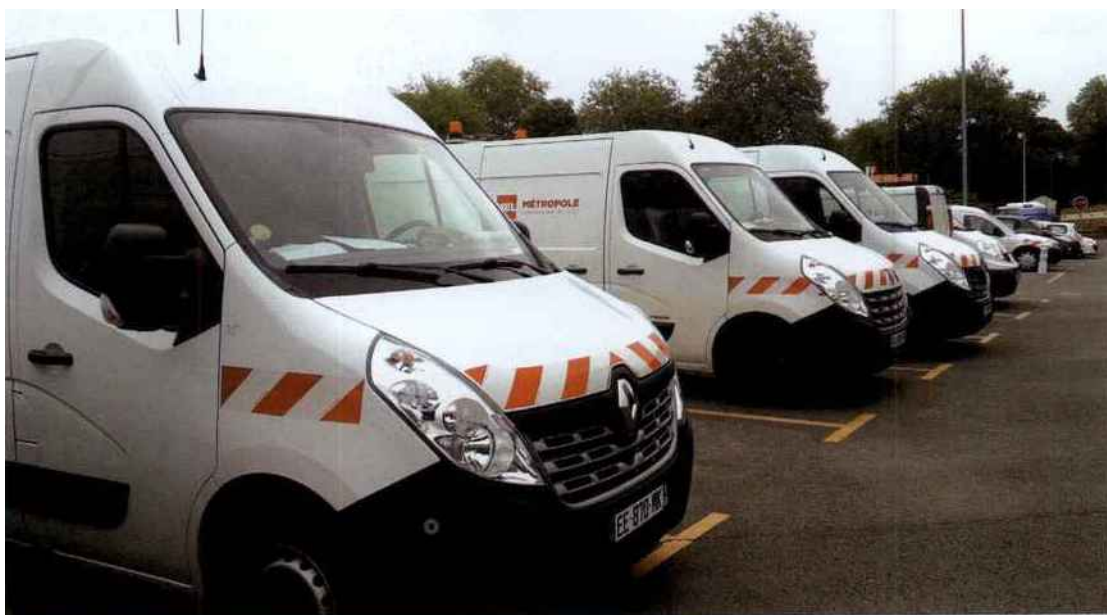
La métropole de Lille a équipé en télématique sa flotte de 720 véhicules, hors véhicules de fonction, avec à la clé une baisse significative des kilométrages : de 10,6 millions de kilomètres parcourus en 2013, à 5,9 millions en 2014.