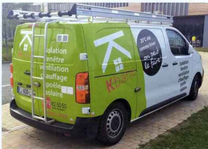
Chez Kbane, spécialiste de la rénovation énergétique de l'habitat à la tête de 150 véhicules, les données récoltées via la plateforme du télématicien sont l'occasion d'un palmarès hebdomadaire du comportement des conducteurs.